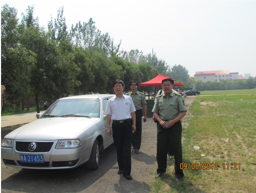
雷达书记检查工作