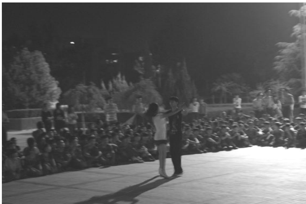
迎新会热烈的气氛