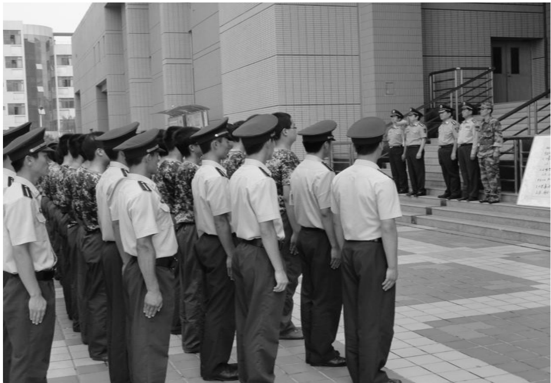
白华政委一行慰问军训师现场