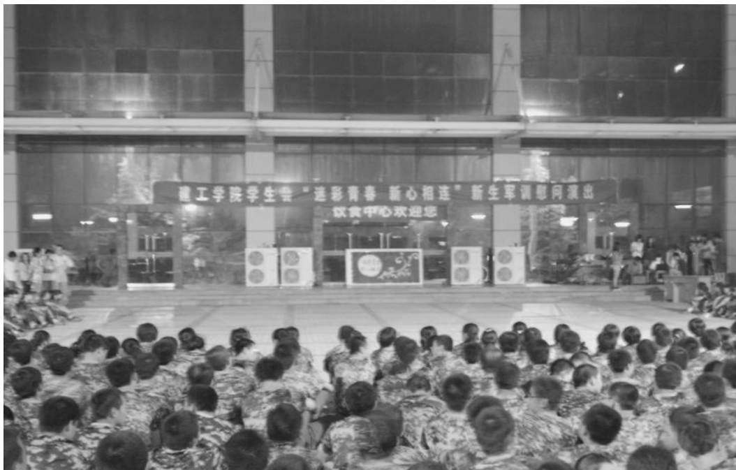
建工学院迎新晚会现场