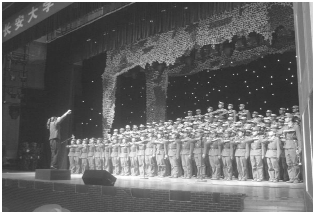
军训师歌咏比赛现场