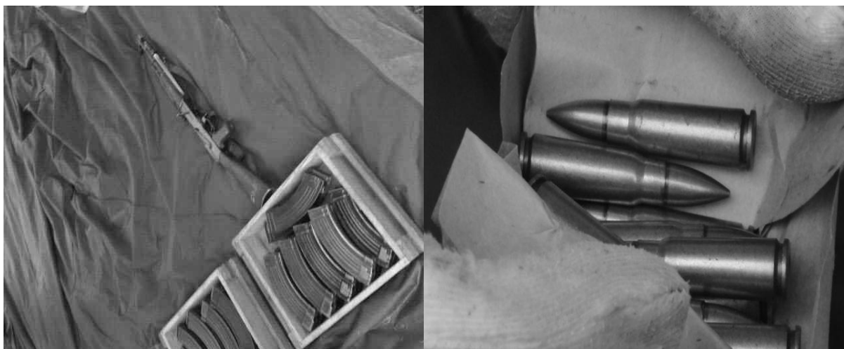
教官为我们展示此次射击使用的五六式冲锋枪及子弹。